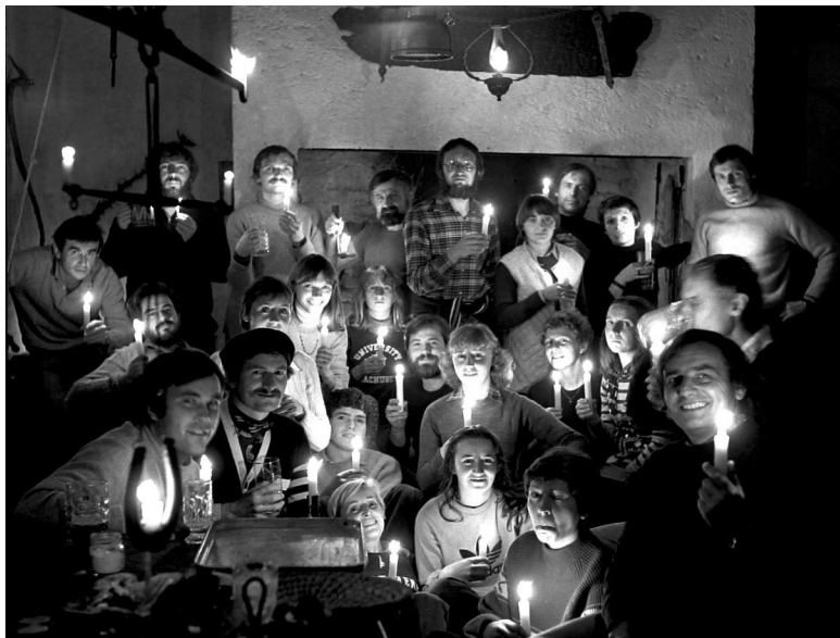
Naši nástupci (pod vedení, nebo za přítomnosti Pegase, Joba a Yška