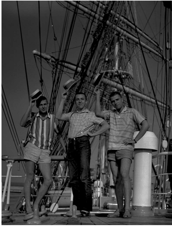
Zlatá mládež Prvostředěčnicků na moři v roce 196?

A takhle skromně se připravoval Bratřka plavbu Gospou v r. 1934: